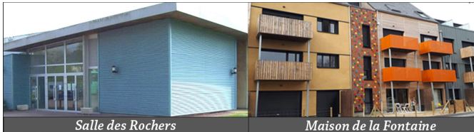
Salle des Rochers

Retrouvez toute l'actualité de votre commune sur www.lachapellethouarault.fr et sur Facebook / La Chapelle-Thouarault