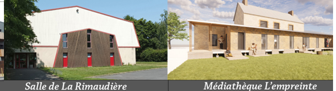
Salle de La Rimaudière